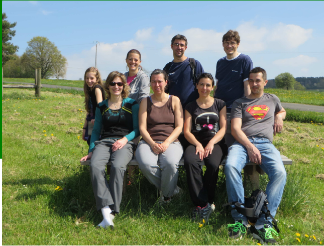
L'équipe de repérage rando 2014