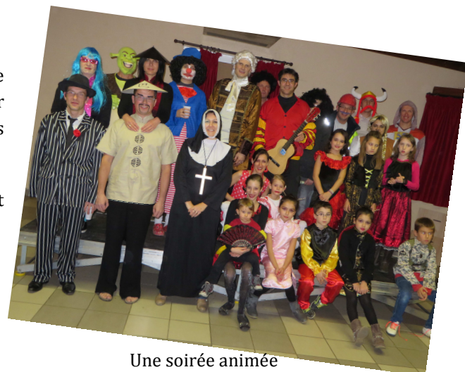
Une soirée animée