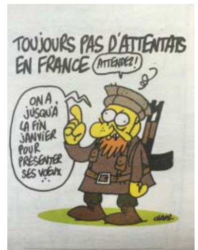
Dernier dessin de Charb paru le 7 janvier dans Charlie Hebdo, sûrement prémonitoire.