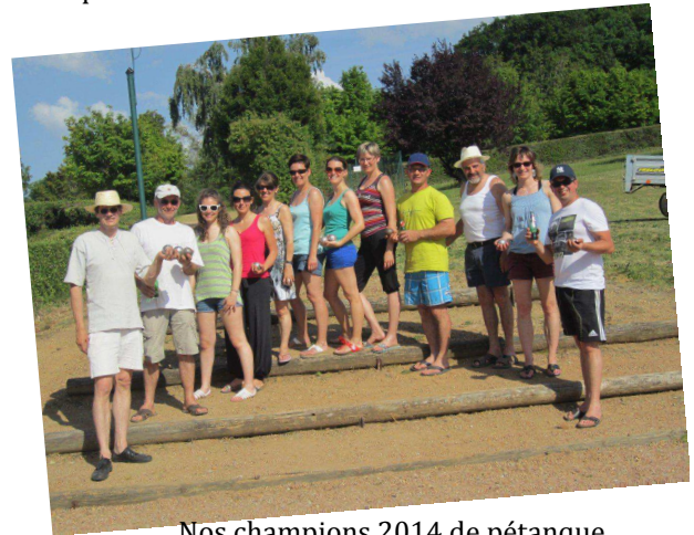
Nos champions 2014 de pétanque