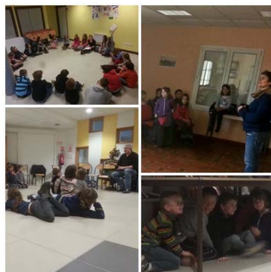
TAPS : séance théâtre du 12 janvier

De la rentrée de janvier jusqu'aux vacances d'hiver, tous les élèves pourront participer à une activité théâtre, animée par la troupe « pupitres et compagnies ». Pour le reste de l'année, à partir du 23 février, il y aura sport, arts plastiques, musique, jardin, premiers secours, animation avec la bibliothèque municipale et poterie.