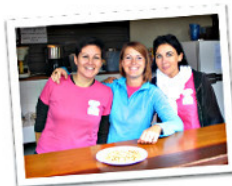
Une buvette enthousiaste