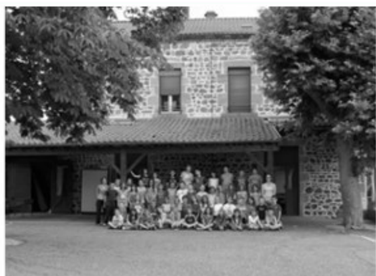
L'école de la Martre