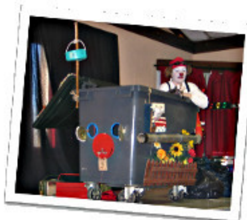
Miss LuLu et les Zéboueurs