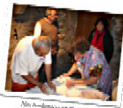
Nous sommes prêts pour vous